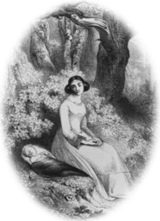
Eloísa y su hijo Astrolabio